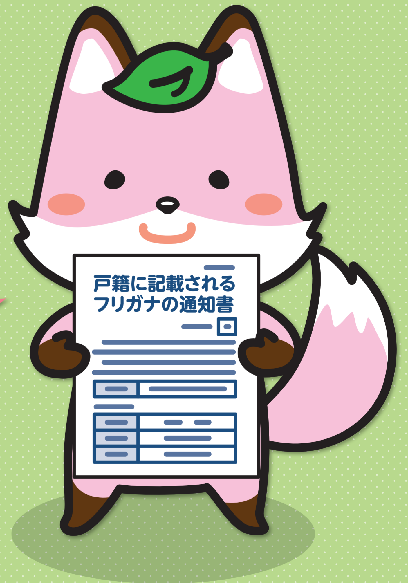
戸籍制度マスコットキャラクター 「コセキツネ」