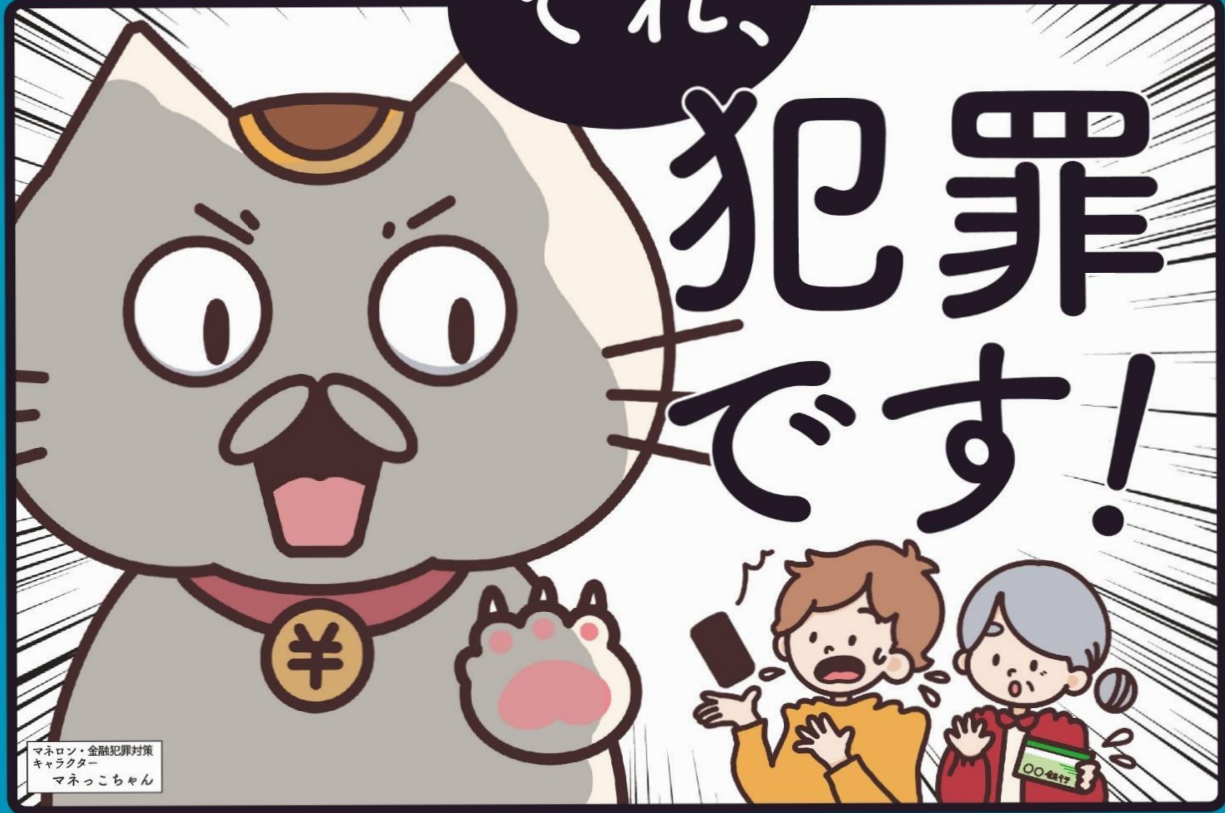
マネロン・金融犯罪対策 キャラクター マネっちゃん

口座を売ったり貸したりすると 罪になります！ 他の金融機関でも口座の開設や利用が できなくなる場合があります