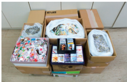
ベルマーク等 収集・寄贈

各支店においては、地域のお祭りやイベント等各種行事へ積極的に参加し、地域の皆さまとの親睦・交流を図るとともに、一部の支店においては、夏祭りやぜんざい会を開催するなど地域の活性化に寄与する取組みを実施しています。