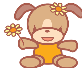
けんしんキャラクター “ハッピー”