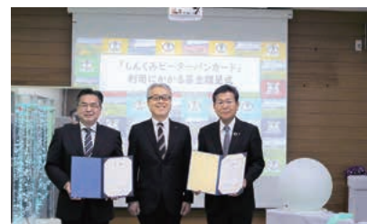
小野市立小野特別支援学校へ寄贈