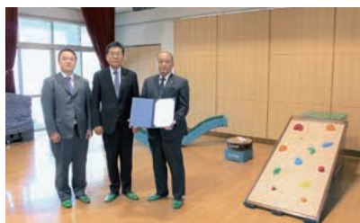
北播磨子ども発達支援センター事務組合 わかあゆ園へ寄贈

当組合では、平成14年から、年1回、県下の障がい児支援施設や特別支援学校等へ寄付活動を継続して行っており、今回で22回目、累計寄贈額は、約1,381万円となりました。