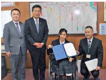
兵庫県立和田山特別支援学校へ寄贈

当組合では、平成14年から年1回、県下の障がい児支援施設や特別支援学校等へ寄付活動を継続して行っており、今回で23回目、累計寄贈額は約1,488万円となりました。