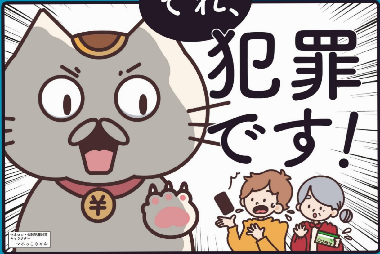
マネロン・金融犯罪対策 キャラクター マネっちゃん

口座を売ったり貸したりすると 罪になります！ 他の金融機関でも口座の開設や利用が できなくなる場合があります