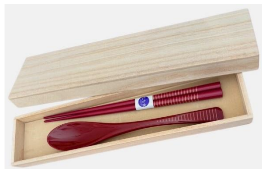
お箸&スプーンセット

※ご紹介いただきましたお客さまの当組合での年金受給・予約の手続きが確認できましたら それぞれの方に進呈いたします