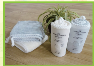
マイクロファイバーフェイスタオル2枚組